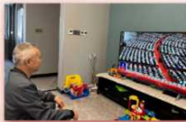
锡山三建组织观看党的二十大开幕盛况